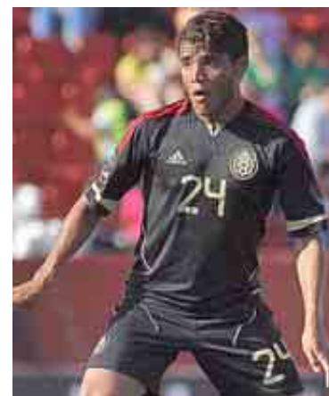
Jonathan dos Santos.

El futbolista está dispuesto a hacer unas acciones solidarias. "He estado hablando con el club y, por iniciativa propia, he decidido participar en unos actos solidarios con la Fundación del Barça y también en algo en México para compensar los daños que he podido causar", dijo.