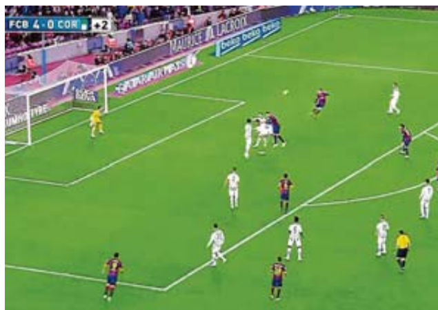
Publicidad excesiva durante un partido en el Camp Nou.

El minucioso control a que están expuestos entrenadores, jugadores y propietarios en la Premier son ya famosos en todo el mundo. Cualquier desliz se paga en forma de multa o sanción deportiva de manera severa y con poca posibilidad de recurso. Una crítica al árbitro o un comentario desafortunado en las redes sociales