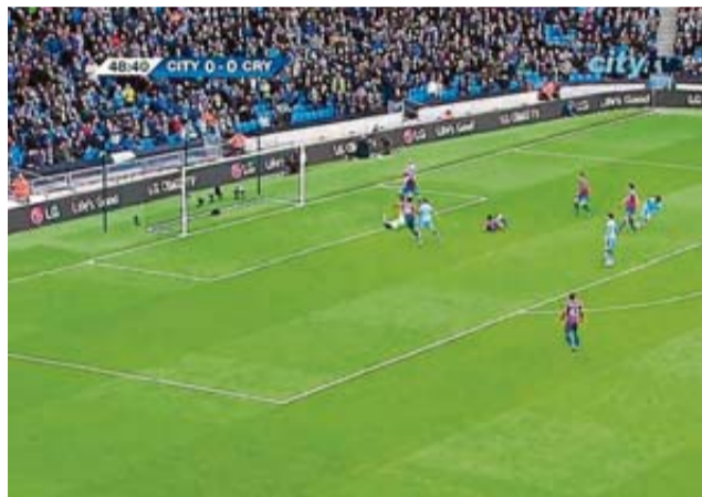
En la Premier hay menos, y por tanto más cara, publicidad estática.

puede tener consecuencias muy desagradables.