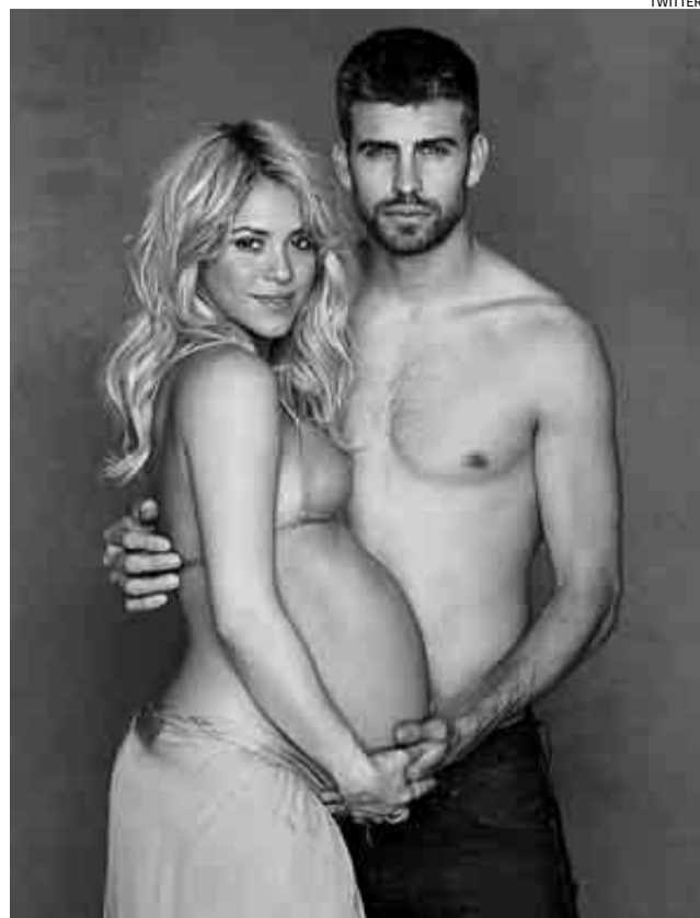
La red social recogió el embarazo de Shakira, en la imagen, con Piqué.

cial, al promediar nada menos que 8,93 tuits por día. Le sigue el nuevo jugador del Atlético de Madrid, Leo Baptista, con 6,22.