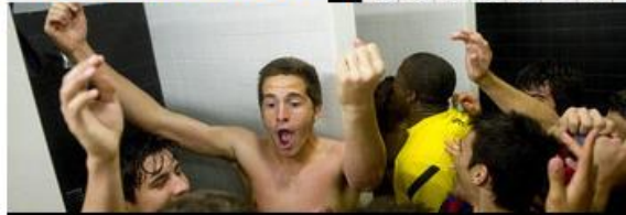
El álbum de Robert