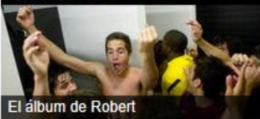
El álbum de Robert